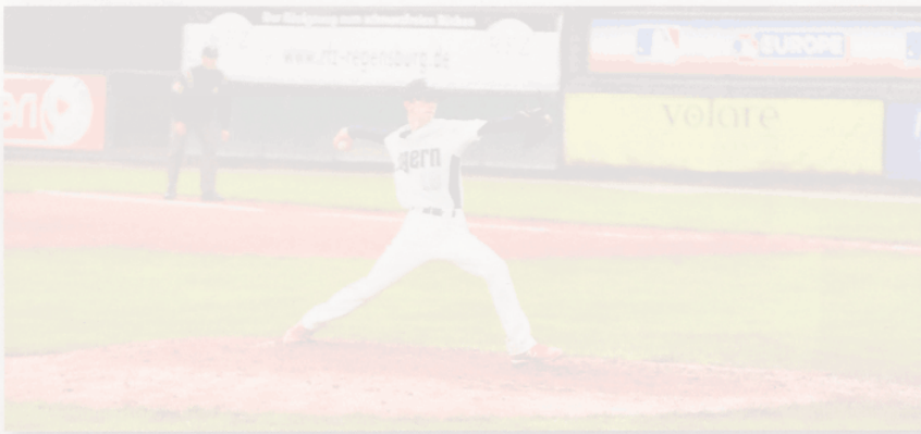
Lennart Greska beim Länderpokal in Regensburg